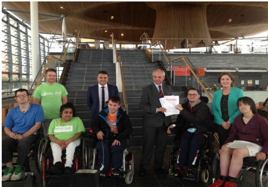
Whizz-Kidz yn cyflwyno deiseb i'r Cynulliad, yn dilyn gweithdy ymgysylltu â phobl ifanc yng Nghaerdydd